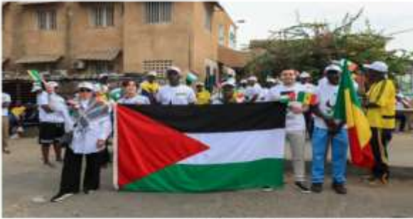
مظاهرة تضامنية مع غزة في العاصمة السنغالية دكار

2025/4/23 11:29:00 تم تحديث 00/4/2025 03:29 بر إيجابية معاً سنكفيها