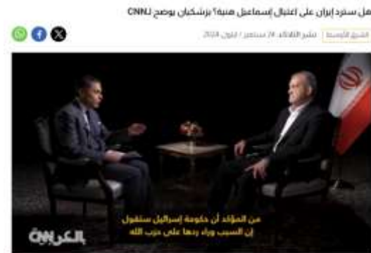
تمتد متحج شبكة CNN، تميزاً بكونها، مع الرئيس الإيراني محمود بريجنكيان، حول الصراع القائم بين حزب الله وإسرائيل، وعما إذا كانت إيران ستدعم على الإطلاق رفض المطالب الفلسطينيين بحركة حماس، إسماعيل هنية، في طهران.

وخرجت العديد منه الجهات الدولية للمطالبة بوقف إطلاق النار، والتأكيد على بشاعة الأوضاع الصحية، ولعل أبرز الأمثلة على ذلك الموضوع المنشور بموقع قناة الجزيرة، بعنوان: (الأمراض والأوبئة تجتاح غزة)، وجاء في متن الموضوع: (ووفقاً