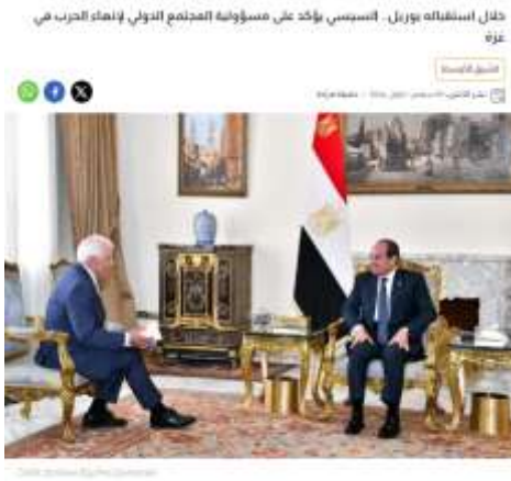
في الإمارات العربية المتحدة (CNN) - لدى الرئيس المصري عبدالفتاح السيسي - الاثنين - على المسؤولين التي اتفق على حلها المجتمع الدولي، وهناك الأوبى، للضغط المتكثف من أبناء الجيش لإنهاء وقف المجدى من

جاءت أداة (التصريحات الرسمية) في مقدمة أدوات تقديم قضايا الحرب الإسرائيلية على غزة في مواقع القنوات الفضائية عينة الدراسة، وذلك بنسبة مئوية بلغت (٨٢.٧%)، وفي الترتيب الثاني جاءت أداة (الخلفيات التاريخية) بنسبة (٩.٨%)، فيما جاءت أداة (النصوص القانونية) في الترتيب الثالث والأخير بنسبة (٧.٥%).