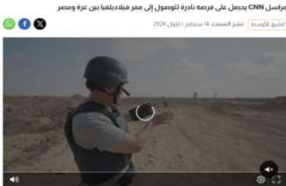
مدون مراسل القنوات العالمية في شبكة CNN ماريو تشافيس على فرصة نادرة للوصول إلى ممر فيلاديلفيا وهو أكثر خطورة التي تربط قطاع غزة بمصر والتي أمر نتنياهو على أنه يجب أن يمر عبر إسرائيل في حالة الوصول إلى أي اتفاق مؤقت لإطلاق النار.

جاءت (التجارب الواقعية) في صدارة أسانيد التأييد والرفض لقضايا الحرب الإسرائيلية على غزة في مواقع القنوات عينة الدراسة، وذلك بنسبة مئوية بلغت (٤٦.٨%)، وفي الترتيب الثاني حل (التعبير بالغضب) بنسبة (٢٨.٧%)، فيما جاءت (إحصائيات وبيانات) في الترتيب الثالث بنسبة مئوية (٢٤.٥%).