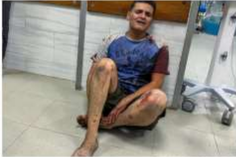
الفتى يواصل جملته في علاج جرحه في الجرحى

لسان حال أهل غزة "لقد أسمعت لو ناديت حيا ولكن لا حياة لمن تنادي"