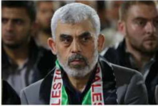
السنوار مع بقايا أسرته بعد استشهاد السنوار في معركة مع قوات إسرائيلية برفح

11/10/2014 | آخر تحديث: 11/10/2014 | 09:25 م | تعليقات: 0 | 0 | 0 | 0