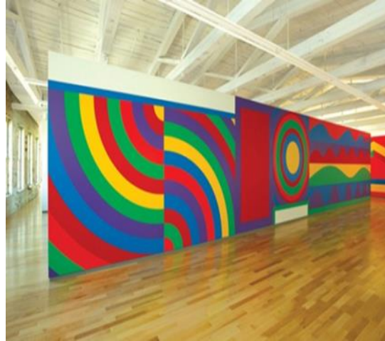
شكل رقم ١٢ - سول ليويت 2003 - Sol LeWitt مخططات ملونة circulation plan

و لإثبات هذا المفهوم concept ؛ بدأ في تصميم لوحات كبيرة تغطي جدران مكان العرض ، وتنفذ من قبل أشخاص آخرين ومتغيرين في كل مرة . وكانت فكرته هي أن يد كل شخص سترسم بشكل مختلف على الرغم من أنهم يعملون من نفس مخطط التصميم المعقد ، فإن كل فنان يرسم بشكل مختلف عن أي شخص آخر. ومن هنا يدل على فكرته حول ان اللوحة النهائية قد تختلف عن التصميم الأصلي وفقا لمن يقوم بالتنفيذ ، وأن التصميم الأصلي هو كل ما يهم ، والاختلافات في التنفيذ لا تغير من الفكرة الأصلية حتي لو نفذت في أزمنة مختلفة ، وفنانين مختلفين في كل مرة ، فكان يسعى جاهداً لتحويل الفن إلى عملية أكثر تعاونية collaborative للتأكيد على مدى أهمية دور التعاون في المجتمع . ووظف عددا لا يحصى من الفنانين للمساعدة في تنفيذ أعماله التي رسمت على جدران داخلية انشئت وركبت خصيصاً لهذا وفقاً لمواصفات (ليويت) الخاصة – في العمل المركب - مربع مع أشرطة مكسورة من اللون Square with broken