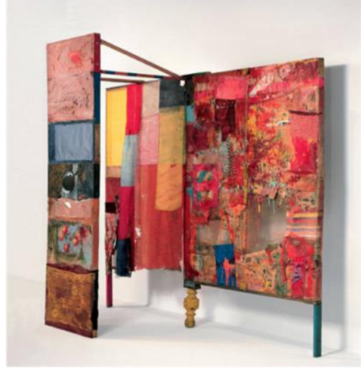
شكل رقم ٣ - التفاصيل الدقيقة Minutiae-١٩٥٤ عمل COMBINE يجمع بين: ألوان الزيت والورق والنسيج وورق الصحف والخشب والمعدن والبلاستيك مع مرآة على سلك مجدول على هيكل خشبي (٦,٢١ x ٧,٢٠ x ٧٧,٥ سم) مجموعة خاصة

ونتيجة لأهمية الفكرة التي اصبحت تطغى على أهمية الأسلوب والتقنية ؛ لجأ الفنانون في تجربة كل اسلوب ممكن لتنفيذ الأفكار . فيمكن للعمل الفني أن يحتوي على صورة، أو لوحة، أو رسما، أو رمزا، أو عبارة مكتوبة على سطح ماء، أو فن ادائي يعبر عن الفكرة، وبذلك أصبح تصنيف نوع الفن شيء نسبي، وأصبح عنوان ومسمى اللوحة هو الذي يفسر الفكرة.