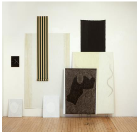
شكل رقم ١٠ - أفيس نيومان Avis Newman رفرقة الفراشة Flutter by butterfly, 2010/2012