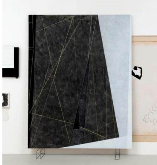
شكل رقم ٩ - أفيس نيومان Avis Newman في موكب --In Procession, 2019 أكريليك وطباشير على لينين وقماش من القطن السميك وورق

نشأة العلامات من خلال النقوش والصور المشفرة . وتهتم ( نيومان ) بمفهوم حدود اللوحة والحواف والتأطير، وحددت أعمالها على أنها (تكوينات Configurations ) وتجميع من لوحات كثيرة القابلة للتبديل على شكل طبقات ، و معلقات قد تتداخل جزئيا . تلك التكوينات يتم ترتيبها في مجموعات ، و تسلسلات غير دائمة التثبيت . لذلك تقدم هذه الأعمال سلسلة من العلاقات المحتملة التي تتجاوز الحدود الثابتة وتصبح مؤقتة ؛ مثلما في الطبيعة التي تمتلك مرونة التغيير في التكوين العام ، وتقديم تكوينات جديدة . قد لا توحى الصور بأي تمثيل الأشياء من العالم الواقعي ، ولكنها أصبحت أشياء واقعية في حد ذاتها من خلال التعبير بفن التصوير كنموذج من التعبير المادي الظاهري لـ "عمليات الفكر الداخلية operations of thought". كما قدمت مجموعة تسمى (الإيماءة والفعل Gesture and Act)، التي ارتبطت بالعمليات اللاواعي واللغة ونشأة الكتابة من خلال مساحات تخطيطية مليئة بالأشكال المشفرة والهياكل التخطيطية المتعددة النصوص النفسية psychic texts أو وظائف الرؤية vision functions، كعمليات فكرية فلسفية وأدبية - شكل ٩ و ١٠ - . ومن خلال تلك التجميعات تم كسر الإطار المغلق للوحة التصويرية وتوظيف الفضاء التركيبي للتصوير ، مع تجسيد إيقاعات الحركات واجترار العقل المدرك جزئياً في عمليات الفكر. وقدمت سلسلة من العلاقات المتنقلة مليئة بالتناقض ، وعدم الاتساق و تعددية الأشكال ، ومساحات لها قدرة علي التوسع المتغير ٦ .