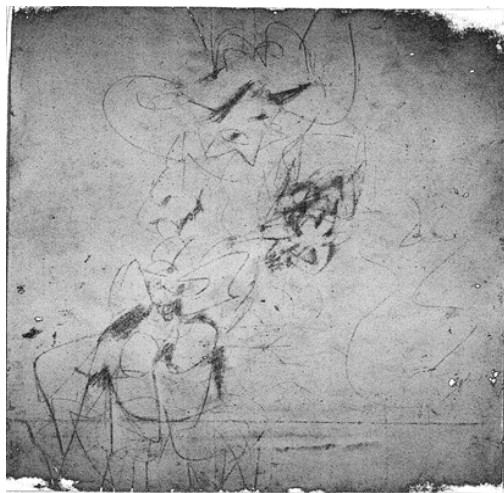
شكل رقم ٢ - دي كونينج -De Kooning-لوحة رسم حي ( Dessin animé 1953فحم-رصاص - أقلام حبر -لوحة تم محوها