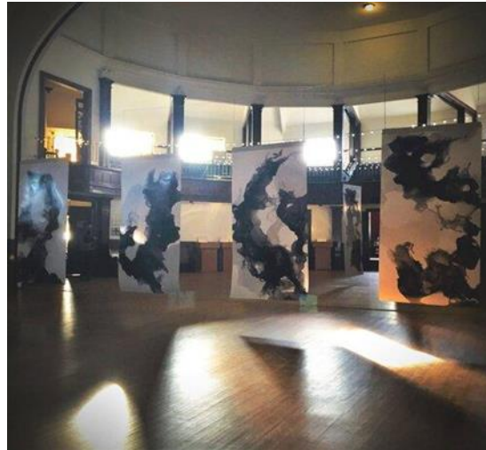
شكل رقم ١٨ - سیاو یانغ , XIAO YANG تصوير مركب "PAINTING INSTALLATION ذاكرة الماء" " Water Memory" خامات مختلطة ٢٠١٩-

اما اعمال التصوير المركب الخاصة بالفنانة (سیاو یانغ Xiao Yang) امتلأت بالتجريدات السائلة على شكل قناة مائية متدفقة مما يقربها من اساليب الفنون اليابانية، التي هي هوية الفنانة الأصلية، بالتوازي مع موضوعها الشخصي، حيث تحاول الفنانة وضع نفسها داخل الثقافة الجديدة والبعيدة عن جذورها الثقافية الاصلية، وقدمت ذلك في لوحات مركبة تشبه المنزل أو (الوطن) كتعبير عن تحولات في الهويات الشخصية. كما تتناول في أعمالها فكرة ان الشيء الأصغر حجما، شيء