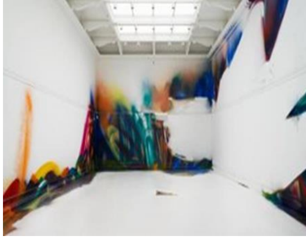
شكل رقم ٢٢- كاترين جروس – Katharina Grosse هذا دفع والدتي إلى أعلى الجدار (٢٠١٧) - This Drove My Mother Up The Wall الوان اكريليك على الأرض والحائط

وفي عملها (دفع والدتي إلى أعلى الجدار (٢٠١٧) - This Drove My Mother Up The Wall ) - الشكل رقم ٢٢- في هذا العمل قامت بالتصوير المباشر على حوائط مكان العرض ، وجعلت من الفراغ هو العنصر الأساسي ، حيث أخفت بعض المساحات بعازل من البلاستيك ، ثم رسمت فوقه وفوق الجدران المحيطة. وعند ازالة العازل، تم الكشف عن المناطق البيضاء الزاهية من الأرضية، والتي لم تمسها علامات الألوان المنتشرة على جميع الجوانب الأخرى. ٧٨