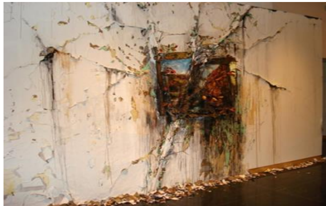
شكل رقم ٢٤- فاليري هيغاتي- Valerie Hegarty بداية جديدة (سلسلة يوميات كوفيد)، Fresh Start (The Covid Diaries) (Series)، خشب، قماش، ورق، غراء، سلك، شرائط لاصقة، طمي إيبوكسي، ٢٠٢١.