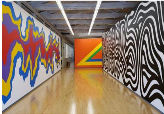
شكل رقم ١٣ سول ليويت - Sol LeWitt عمل تصوير مركب- رسم حائط - استيعادي، 2008 A Wall Drawing Retrospective