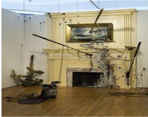
شكل رقم ٢٣- فاليري هيغاتي- Valerie Hegarty منظر بحري (اعالي البحار) Seascape: Overseas مدفأة مع حراب- Fireplace with Harpoon ، فووم، ورق، ألوان أكريليك، غراء ووسيط جل، حوالي ١٠ × ٨ × ٨ بوصة، ٢٠٠٦

وفي عملها (دفع والدتي إلى أعلى الجدار (٢٠١٧) - This Drove My Mother Up The Wall ) - الشكل رقم ٢٢- في هذا العمل قامت بالتصوير المباشر على حوائط مكان العرض ، وجعلت من الفراغ هو العنصر الأساسي ، حيث أخفت بعض المساحات بعازل من البلاستيك ، ثم رسمت فوقه وفوق الجدران المحيطة. وعند ازالة العازل، تم الكشف عن المناطق البيضاء الزاهية من الأرضية، والتي لم تمسها علامات الألوان المنتشرة على جميع الجوانب الأخرى. ٧٨