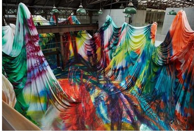
شكل رقم ٢١ - كاثرين جروس - Katharina Grosse - هروول الحصان مترين آخرين - The Horse Trotted Another Two of Meters (8000 متر مربع) ( تم عرضها في مستودع عملاق يسمى - Carriageworks كارياجووركس