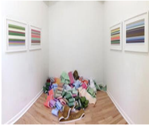
شكل رقم ٧ - ديبرا رامزي- Debra Ramsay تم عرضها في عام ٢٠١٧ في ديبفورد ، المملكة المتحدة ٢٠١٧، UK, Deptford in

والتوقيت والمساحة ، وألوانه تنبض وتصبح أكثر تأثيراً من خلال تكرارها وانعكاسها. وفي نفس السياق نجد أعمال المصورة التجريدية الأمريكية المعاصرة (ديبرا رامزي Debra Ramsay ١٢ ) تركز على جماليات ونظريات الضوء واللون فتتبع ألوان الطبيعة مثل ألوان النباتات وفقاً للمواسم ، وتقوم بتحليل تغيرات الألوان في برنامج رقمي، ثم تستخدم التحليلات الناتجة في لوحات تشير إلى الألوان الطبيعية المتغيرة ، وتأثير تغير الضوء عليها ؛ من أجل التأثير على المتلقي بشكل يجعله يندمج مع مفاهيم ونظريات الضوء والفراغ . كما تستخدم تراكمات تجريدية ديناميكية الحركة في لمسات اللون، لعمل دلالات وعلامات تدل على مرور الوقت والتغيير والمكان. - شكل رقم ٧- حيث يعكس العمل فكرتين أساسيتين يهيمنان على الثقافة المعاصرة؛ الأولى هي فكرة جمع البيانات ورقمنة كل جوانب الحياة ومراقبتها وتحليلها، والفكرة الثانية هي التغييرات المتلاحقة في الطبيعة وكيفية إيجاد الجماليات من خلال مراقبتها وإعادة تقديمها. تحتوي أعمال التصوير المركب للفنانة (ديبرا) على عناصر ملونة في تكوينات مرنة وفقاً لبيئة المكان المحيط؛ لتجسيد طرق تحليل ألوان المناظر الطبيعية، كنوع من تجسيد المكان والزمان، من خلال استخدام الألواح الشفافة، والحرير الشفاف لتمكين الرؤية من خلاله. - شكل رقم ٨ - وقامت بإنشاء عمل تصوير مركب مكون من ٧٢ لونا مختلفا وتم تطبيقها على فيلم راتنج البوليستر polyester resin في شكل شرائط شفافة معلقة من السقف أو متموجة عبر الأرض، بالإضافة إلى لوحات معلقة على الحائط للألوان الأساسية ١٣ :