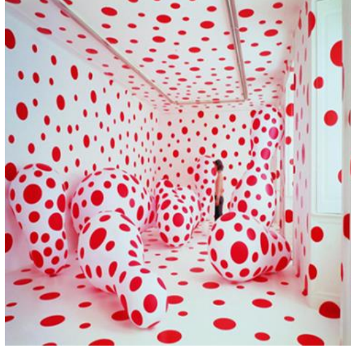
شكل رقم ١٥ - يايوي كوساما Yayoi Kusama مركب هاجس النقاط 2000 - Dots Obsession, Installation

الهالوس hallucinatory. ويبدو ان دراستها للتصوير الياباني نيهونغا Nihonga painting ٦ له تأثيرا قويا علي طريقة تفكيرها في البداية ، ثم عملت علي كسر كل القواعد الفنية له في العمل الذي حدد أسلوبها المميز - شبكة لا نهائية Infinity net حيث ملأت نقاط البولكا polka dots الجدران والأرضيات . وواصلت إنتاج الأعمال الفنية في مجموعة متنوعة من الوسائط المتعددة ٧ .