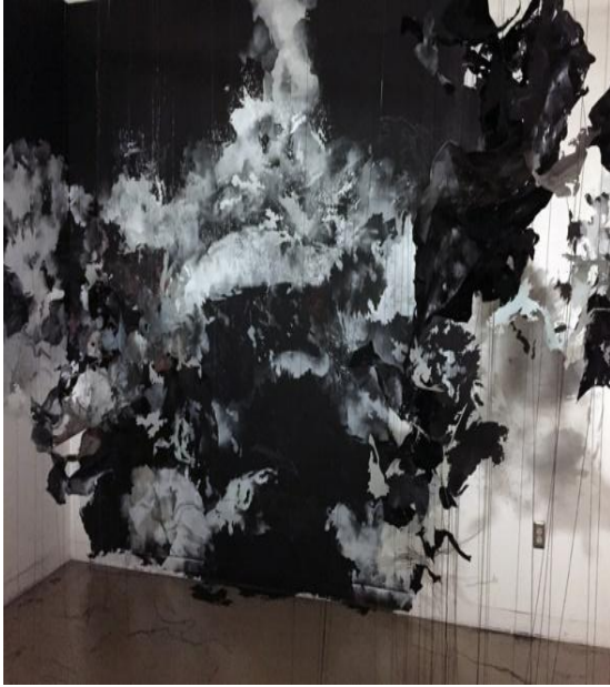
شكل رقم ٢٠ - جويتا ويسزوميرسكا Jowita Wyszomirska - شركاء مخفيين Unseen Patterns - 2015 الوان - اقلام - ورق - شرائط جوخ - اسلك