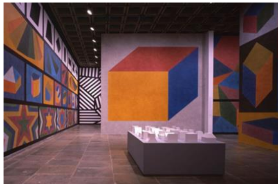
شكل رقم ١٤ سول ليويت Sol LeWitt عمل تصوير مركب: استيعادي " A Retrospective 2000

تعتمد الفنانة (يايوي كوساما Yayoi Kusama) على الفن المفاهيمي في أعمالها. وتشتمل على أشكالاً، وأنماطاً عضوية متكررة، والألوان القوية، وانعكاسات، ومساحات كبيرة، وكثافة فنية، وتكرار وإيقاع. كما تتميز أعمالها بأفكار غريبة، تشبه