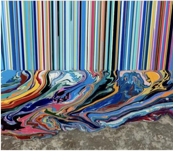
شكل رقم ٦ Ian Davenport ايان دافنبورت منظر ملون Color capes-2018

يتعلق بفكرة أن (لا شيء وشيء) هما قوتان تعاونيتان، وإن الفراغ لا يقل أهمية عن الامتلاء. و المسافة بين جسمين هي جزء من الواقع بقدر ما هو جزء من الأشياء نفسها، والعدم أمر حيوي مثل الوجود. وفي هذا المعرض واجه المشاهدون غرفة بيضاء خالية من اللوحات، تحتوي فقط على خزانة فارغة. وقال (كلاين) عن العرض، "لوحاتي الآن غير مرئية وأود أن أعرضها بطريقة واضحة وإيجابية" ٥ ولتعزيز رؤيته الفنية للأشياء غير المادية The immaterial. قدم الفنان وجهات نظر بديلة عن الواقع في حركة فنية تسمى الواقعية الجديدة New Realism؛ ركزت على طرق جديدة لإدراك الواقع. وفي عمله أحاديات اللون monochromes، قدم لوحات باللون الأزرق الزهري اللترامارين ultramarine معبرا عن وجهة نظره تجاه السماء وإدراك الفضاء اللانهائي، ولم تحتوي اللوحة على أي أثر الخط أو الشكل، مما جعل المتلقي يستحضر رمزية لون السماء والبحر - شكل رقم ٥- عمل تصوير مركب (أزرق مونوكروم) -