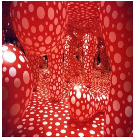
شكل رقم ١٦ - يايوي كوساما - Yayoi Kusama- مركب غرفة لا نهائية معكوسة ، 1998. Infinity mirrored Room

نقطة البولكا بالنسبة الي ( كوساما ) هي الشمس و رمز لطاقة العالم كله ، وهي التي تتحكم في تغير شكل القمر . ودائما ما تكون خلفية اعمالها هادئة ومحايده ، مما يجعل النقاط تبدوا متحركة على الخلفية بشكل لا نهائي وبه نوع من الخداع البصري . وتختلف النقاط في الحجم والشكل، فأحيانا تكون ذات متناقضات لونية حادة أو ذات حواف رقيقة من اللون الأبيض على خلفيات بيضاء؛ وفقا لحالة الفنانة النفسية. وهنا تكمن فلسفة الفنانة حيث تعتبر حياتها "نقطة ضائعة بين ملايين النقاط الأخرى" ٨ وتقول ( كوساما ) "أنا أحارب الألم والقلق والخوف كل يوم ، والطريقة الوحيدة التي وجدتتها خففت من مرضي هي الاستمرار في إنشاء الفن" ٩ . عملها المركب - غرفة الطمس The obliteration room - اعادت صياغته وتكبيره في بيئة متكاملة مع الأثاث والزخارف مطلية بالكامل باللون الأبيض ، ومثلت فيه الأشياء اليومية المستنزفة ، و اعتبرتها قماش للوحة فارغة يتم تنشيطه واستعادته او من وجهة نظر ( كوساما ) "يتم طمسه" من خلال