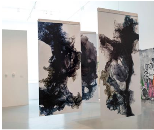
شكل رقم ١٧ - سیاو یانغ , XIAO YANG تصوير مركب "PAINTING INSTALLATION ذاكرة الماء" " Water Memory" خامات مختلطة ٢٠١٧-

التصوير على كل سطح متاح، ووضع ملصقات دائرية ذات ألوان زاهية. وبهذه الطريقة تم طمس كامل للغرفة البيضاء بشكل تدريجي على مدار مدة العرض، وسجلات تغير شكلها مع مرور الوقت حيث تراكمت النقاط الملونة؛ نتيجة تفاعل المشاهدين والمشاركة المباشرة للجمهور. فهي تقوم باحتواء المشاهد بأكمله داخل العمل الفني وتغمره في تراكمات و تكرارات وتملئه بالهواجس ضمن أطر مفاهيمية وجمالية تحدها لتعبر عن أفكارها نحو الكون من خلال مشاركتها مع العالم، وخلق مشاعر متعمدة ليتعاطف معها الآخرون في حياتها المضطربة. توصف احدي النقاد (كلير فون Claire Voon) أحد معارض (كوساما) " أنه قادر على نقلك إلى الكون الهادئ، أو إلى متاهة وحيدة من الضوء النابض، أو إلى ما يمكن أن يكون الأحشاء الداخلية المغلفة للطاغوت المصاب بالحصبة ٦٧ ". و كما قالت الناقدة الفنية (بيداتري د تشودري Bedatri D Choudhury) " أن افتقار (كوساما) إلى الشعور بالسيطرة طوال حياتها جعلها، إما بوعي أو دون وعي، ترغب في التحكم في كيفية إدراك الآخرين للوقت والمكان عند دخول معارضها ٦٨ ".