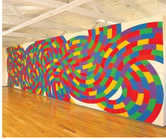
شكل رقم ١١ - سول ليويت ٢٠٠٣ - Sol LeWitt Square with broken bands of color مربع مع أشرطة مكسورة من اللون عمل مركب - أكريليك

اما اعمال الفنان (سول ليويت Sol LeWitt)°٧ تتميز بالمساحات الكبيرة مما يساعده على استخدام الوسائط المتعددة. ومنحت اعماله بعداً آخر لاتجاه التصوير المفاهيمي بعدة جوانب متناقضة. افترض (سول) فرضية أن أهمية الفكرة لا تتجلى فقط من خلال اللوحة المادية ، مع عدم اهمية ان تكون مرسومة من قبل الفنان نفسه او الكيفية التي رسمت بها ، واصبح كل ما يهم هو الفكرة الأصلية التي عبر عنها الفنان من خلال تحضيرات اللوحة . علي حد قول ليويت الشهير: "الفكرة تصبح آلة تصنع الفن".°٨