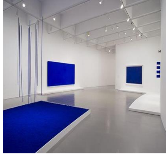
شكل رقم ٥ - عمل تصوير مركب أزرق مونوكروم بدون عنوان -ايف كلاين ١٩٥٦، 27 31 cm x صبغة جافة في وسيط بوليمر صناعي على قطن فوق الخشب

عمل الفنان (ايان دافنبورت Ian Davenport) ٥ شكل رقم ٦- منظر ملون Color capes -على كسر القواعد والتشكيك بها مثل كسر قاعدة (عدم مزج ألوان الزيت بألوان الأكريليك) وهو ما جعله يدرك مدى أهمية تحدي الأفكار المسبقة، والتشكيك في القواعد الثابتة، وترك الحرية لتشكيلات المادة وما قد توحى به للفنان، ومنحها فرصة صنع تشكيلات لا يمكن التنبؤ بها. يقوم (ايان) باستلهام تشكيلات اللون من مصادر مختلفة مثل المناظر الطبيعية، أو من أعمال مشاهير الفنانين مثل (مونييه Monet) أو (تيرنر Turner) ٧ ؛ فاستلهم ألوان ظلال الأصفر، والمغرة، والذهب، والنحاس، والبرونز التي استخدمها (فنسنت فان جوخ Vincent van Gogh) ٨ في تصوير المناظر الريفية. أو يستلهم اللون الأزرق والأرجواني والوردي من لوحات الفنان (بيير بونارد Pierre Bonnard) ٩ يقول الفنان "إن التقاط الألوان من مصدر آخر يجعل التركيبات غير تقليدية وأكثر إثارة للاهتمام بالنسبة لي" ١٠ : يصنع (ايان) لوحاته عن طريق سكب الطلاء على الأسطح الملساء في أنماط خطية متوازية، كما يقوم بإضافة أجزاء نحتية لتتجمع طبقات الطلاء عليها كامتداد مادي للوحات عليها وتبدوا كما لو ان الألوان انزلقت وانسكبت على أرض قاعة العرض. واحيانا تحمل اللوحات نمط الانفجار، حيث يتم بناء الطلاء في طبقات تخلق طاقة وعمق وشظايا في سلسلة من الألوان التي تتكرر بشكل ايقاعي. يقول (ايان) "تدور لوحاتي حول السبولة والحركة وكيف تؤثر الحركة على التركيبات والفراغ" ١١ . وفي مجموعاته الحديثة تتجمع هذه الخطوط والأشكال في دوامات عند قاعدة كل لوحة وبعض الأعمال تحتفظ بالطلاء من الجوانب المتقابلة من السطح، وتندمج في المنتصف في أنماط عشوائية متكررة. أعمال (ايان) إيقاعية في جوهرها وتدعم التكوين والنظام