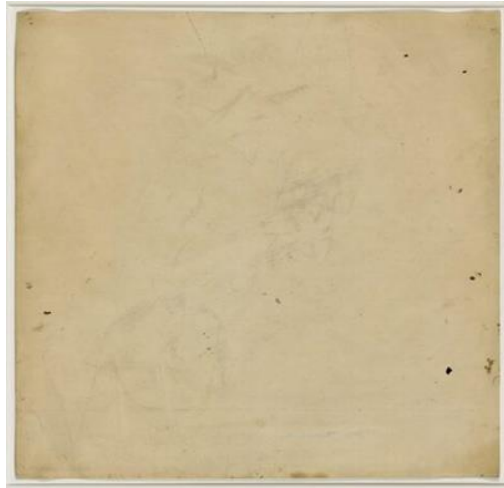
شكل رقم ١- روبرت راوشنبرج -Robert Rauschenberg لوحة رسم تم محوها لكونينج للفنان ٥٥.٢٥ cm x 1.27 cmمتحف الفن الحديث سان فرانسيسكو

ولكن تكون الفكرة هي الأهم من كل القواعد المتعارف عليه، وتكمن الصعوبة في تحويل هذه الفكرة إلى عمل فني متكامل. ويعمل فن التصوير المفاهيمي على مواجهة الفجوة بين الأفكار والواقع المادي، كما يضع في اعتباره أن ليس كل لوحة لابد أن ينتهي بها الأمر إلى التعليق على الحائط، ولكن اللوحة هي عمل فني يمكن أن يكون جزء من عمل فني أكبر، أو يرتبط بمكان أو غرض ما بعيدا عن شكل اللوحة التقليدي. كما من الممكن أن تهتمش اللوحة نفسها؛ وتصبح أقل أهمية من الفكرة ودورها يختصر في التعبير عن الفكرة فقط بعيدا عن الأسلوب والتقنية نفسها. فإن التصوير التركيبي كنوع جديد من فن التصوير، يدمج بنجاح التصوير ثنائي الأبعاد والتراكيب الثلاثية الأبعاد. فهو ليس مجرد مزيج من "التركيبات" و "التصوير"، ولا يعتمد على تحليل الأعمال وفقا لاتجاهاتها وقيمتها الفنية ولكن يعتمد على التأثيرات المتبادلة وتكامل الأدوار واكتمال الأفكار. ففي الأعمال الأولى لفن التصوير القائم على الفكرة والمفهوم لم تنتمي اللوحة إلى الشكل التقليدي للوحات التصويرية ففي عام ١٩٥٣، قام الفنان ( روبرت راوشنبرج Robert Rauschenberg ) ٣ في محو لوحة موجودة بالفعل والاحتفاظ فقط بفكرة المحو وبالتالي منح اللوحة فكرة لها مرجعية جديدة. وفي ذلك استخدم لوحة ذات قيمة لفنان آخر وهو الفنان (ويليم دي كونينج Willem de Kooning ) ٤