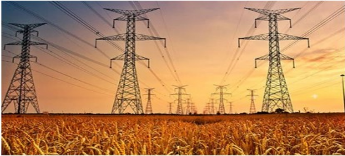
شكل رقم ٣- شبكات الربط الكهربائي

الرأسمالية اللازمة لتلبية الطلب المتزايد على الطاقة.