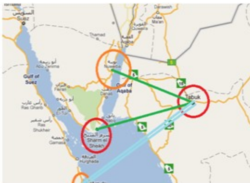
شكل رقم ٢ - الجسر ومسار الطريق الرابط بين مصر والمملكة العربية السعودية

شهدت الدول العربية في السنوات الأخيرة مشروعات ضخمة في كافة مجالات التعمير والتشييد، منها جسور عملاقة تربط فيما بينها برياً، منها ما هو منفذ فعلاً وأخرى قيد الدراسة مثل جسر ما بين البحرين والسعودية - قطر والبحرين - مصر والسعودية - قطر ودولة