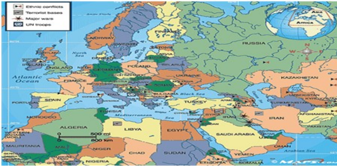
شكل رقم ١ - خريطة العالم العربي والدول الأوروبية

* تفاوت الدخول والإمكانات في الدول العربية يحول دون المضي في طريق العمل المشترك نحو إصدار كودات عربية موحدة تتحمل كل دولة نصيبها من التكلفة.